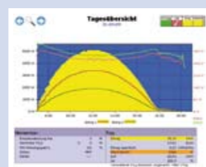
Tagesübersicht: Ertragskurve der WR incl. 2 x Strings und Eingangsspannung